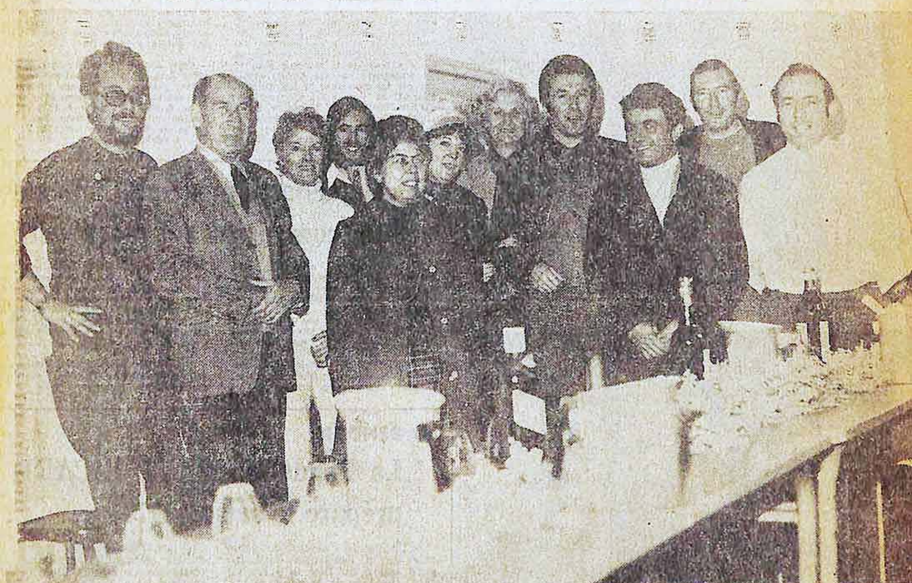
Les organisateurs responsables et les personnalités invitées