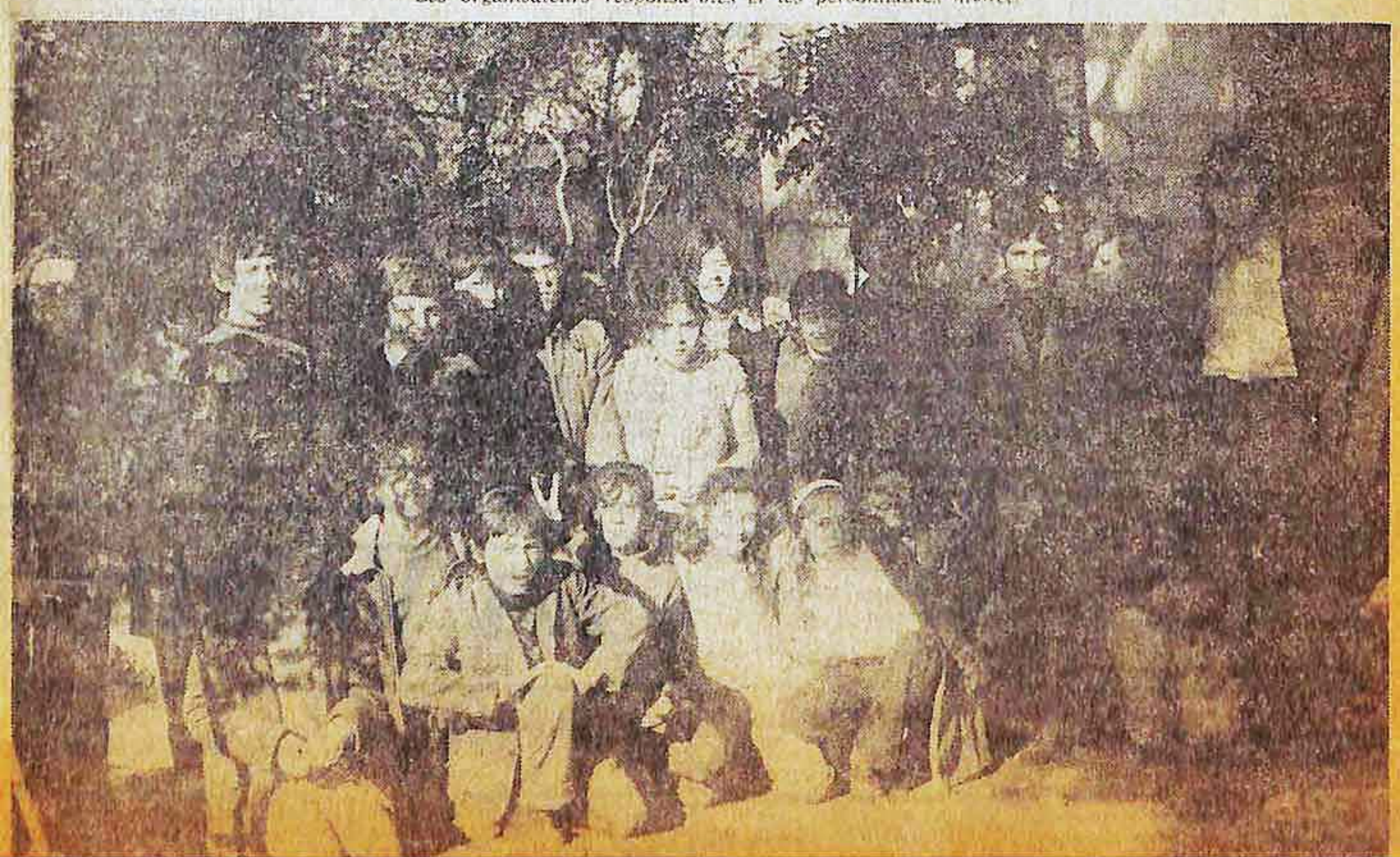
La joie de vivre à « La Dominante »