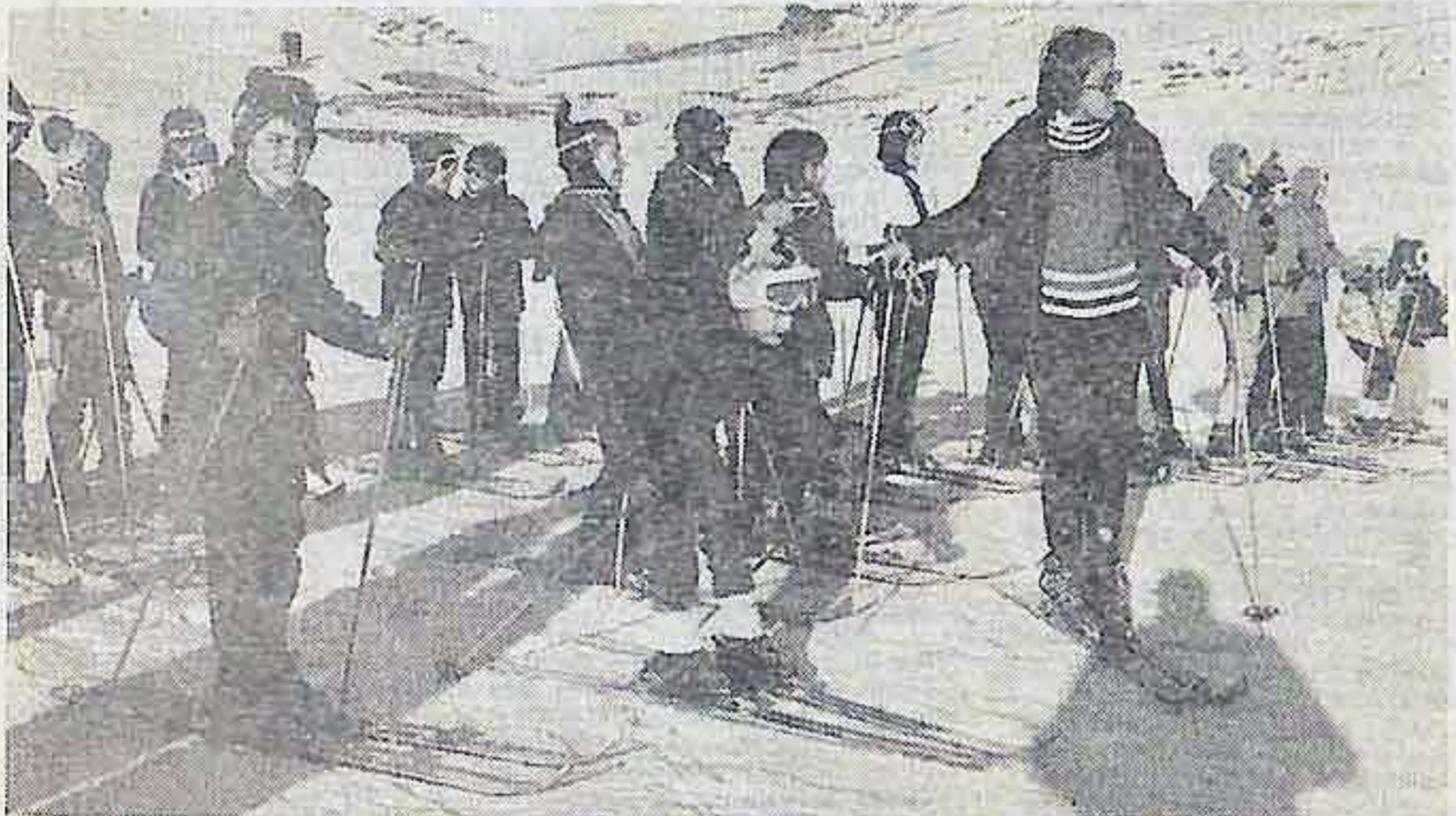
Prêts pour la descente.