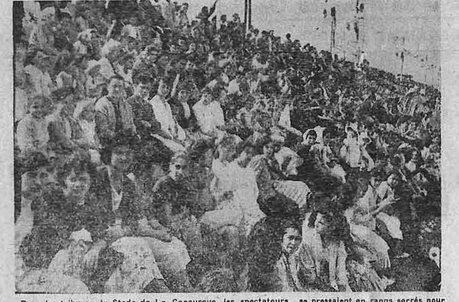
Dans les tribunes du Stade de La Canourguo, les spectateurs se pressaient en rangs serrés pour assister à cette grande fête des Ecoles laïques.

Curie (II), 9 pts; 6. Les Plaines, 4.039 1 bouteille de mousseux. Les lots sont à réclamer au bureau de la caisse des écoles, mairie, rue Messine.