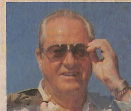
Le Pen : 23 % (32 sièges).