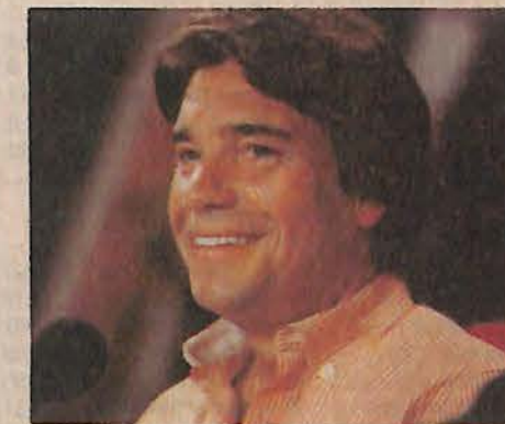
Tapie : 20 % (28 sièges).