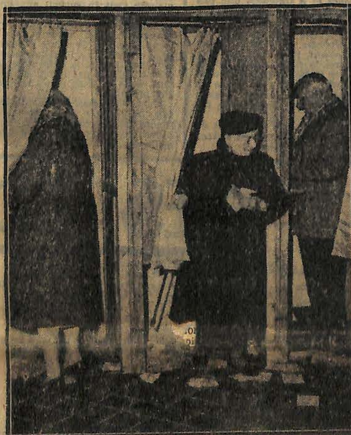
Instantané devant les Isoloirs au Pont-du-Las

(1 er cant. TOULON-LA SEYNE) INSCRITS : 72.225