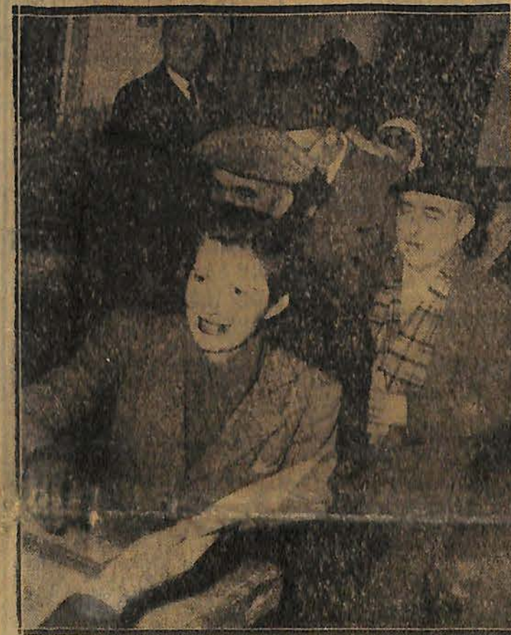
- A voté