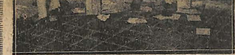
Instantané devant les Isoloirs au Pont-du-Las.