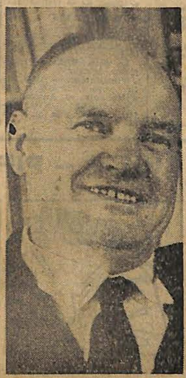
MAURICE THOREZ élu dans la Seine (clrc. Ivry-Vitry) gagne 2343 voix