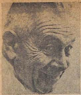
FRANÇOIS BILLOUX AU 1 er TOUR A MARSEILLE

De nombreux Marseillais s'étaient rassemblés hier devant notre journal à Marseille. Ils ont acclamé à son arrivée François Billoux brillamment réélu dans la 4 e circonscription de Marseille.