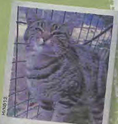
HVNB12 GLOUPSI 2 ans Caline, gentille et joueuse

REFUGE DE BRIGNOLES Rte de Camps-la-Source 83170 BRIGNOLES Tél. 04 94 69 33 37