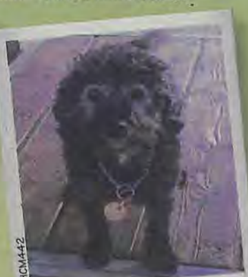
2HCMA42 CRANBERRY 11 ans Je suis tout simplement adorable