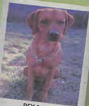
26XX1939 REX 2 ans J'ai tout pour vous plaire