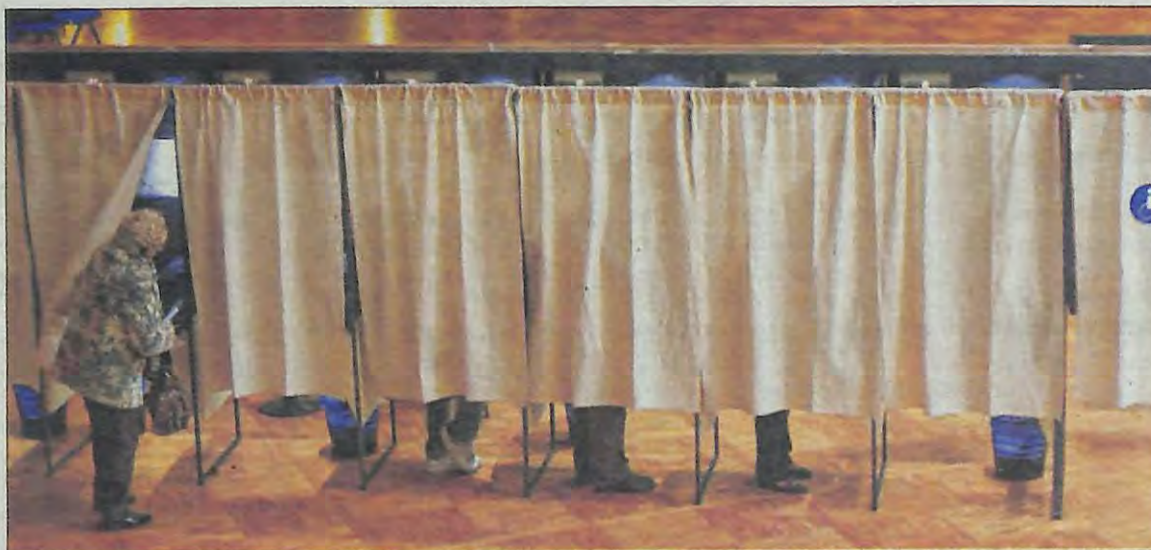
Les bureaux de vote seront ouverts jusqu'à 18 h dans une grande partie des communes du Var. Ils resteront ouverts jusqu'à 19 h dans huit villes du département.

Au mieux, faire plus. Mais au moins, faire autant... Pour les forces politiques en présence aujourd'hui, il s'agira de tenter de