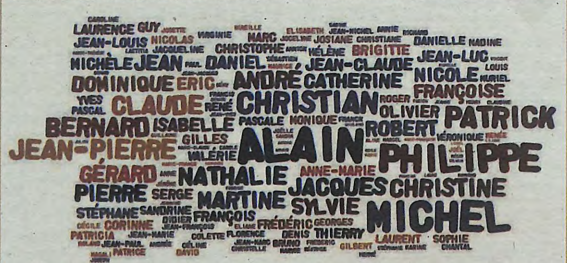
Représentation visuelle des prénoms les plus fréquents chez les conseillers municipaux varois