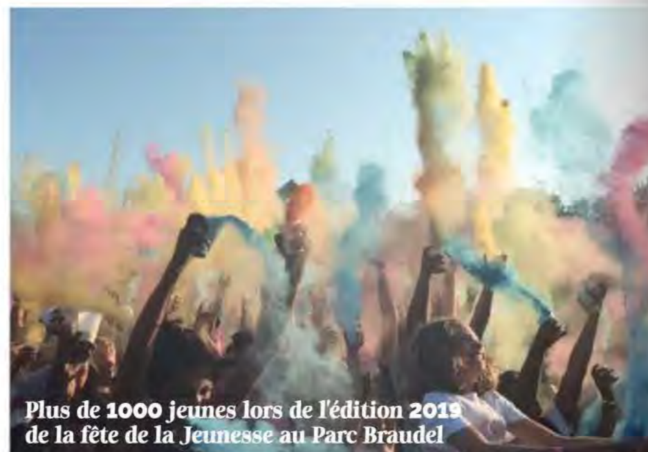
Plus de 1000 jeunes lors de l'édition 2015 de la fête de la Jeunesse au Parc Braudel