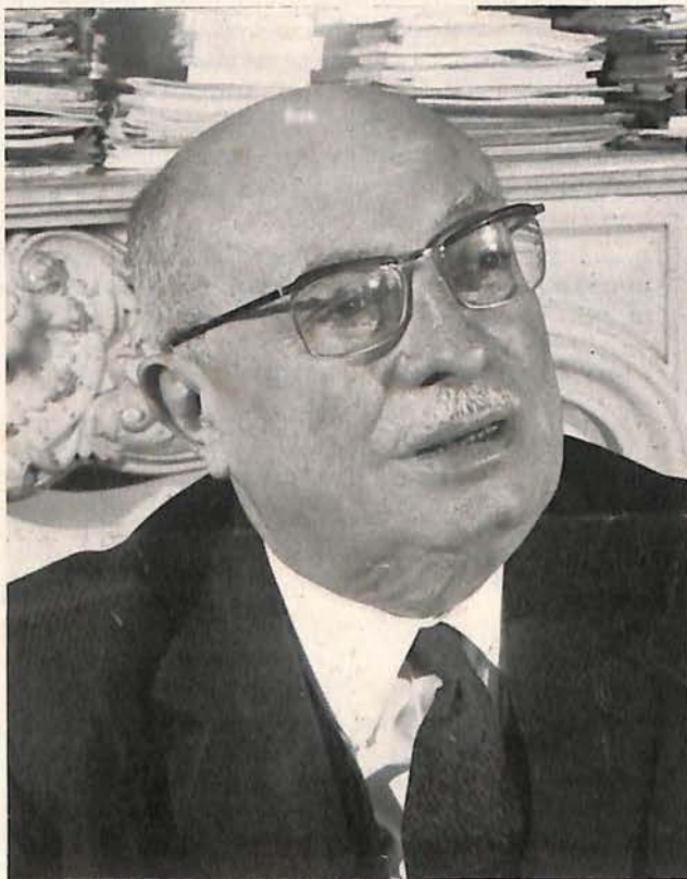
Membre du Bureau Politique du Parti Communiste Français Sénateur Ancien vice-président de la Chambre des Députés et de l'Assemblée nationale