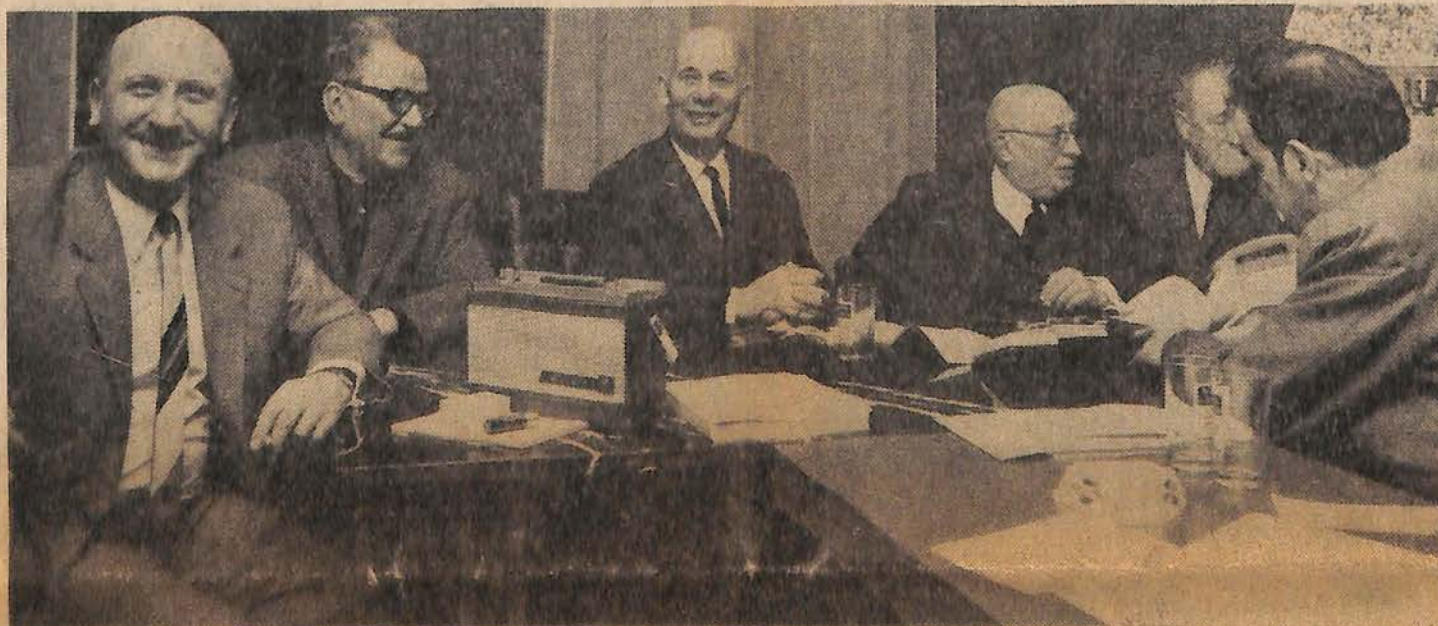
Hier soir, à « l'Humanité », le Bureau Politique suivait, minute par minute, les résultats. De gauche à droite : Henri Krasucki, Benoit Frachon, Waldeck Rochet, Jacques Duclos, Etienne Fajon, Georges Marchais.