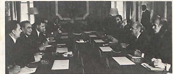
AVEC LES DIRIGEANTS SOVIÉTIQUES

Ses fonctions l'ont amené à représenter la France et à défendre ses intérêts dans les grandes négociations internationales. Il a fait jouer à notre pays un rôle prépondérant dans la construction économique de l'Europe.