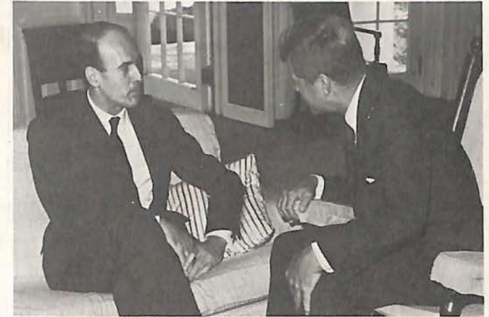
AVEC LE PRÉSIDENT KENNEDY

Ses fonctions l'ont amené à représenter la France et à défendre ses intérêts dans les grandes négociations internationales. Il a fait jouer à notre pays un rôle prépondérant dans la construction économique de l'Europe.