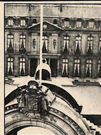
CHATEAU - CHINON OU CHAMALIÈRES ? LAQUELLE DE CES DEUX VILLES PER- DRA SON MAIRE ?

Qui va crier : BRAVO MONSIEUR LE MAIRE ?