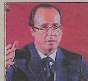
F. Hollande hier soir.

Marine Le Pen, présidente du Front National. « Les masques vont tomber. Montebourg va-t-il défendre ses idées ou tenter de négocier un ministère ? »