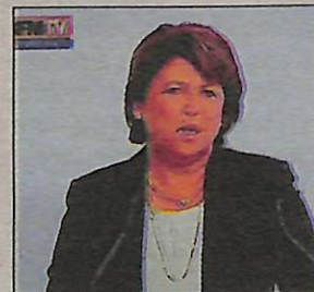
Martine Aubry hier soir.

Martine Aubry. « Nous avons montré une belle image de la politique, et donné un avant-goût d'une belle équipe de France que nous pourrions composer. Je battrais M. Sarkozy en 2012. »