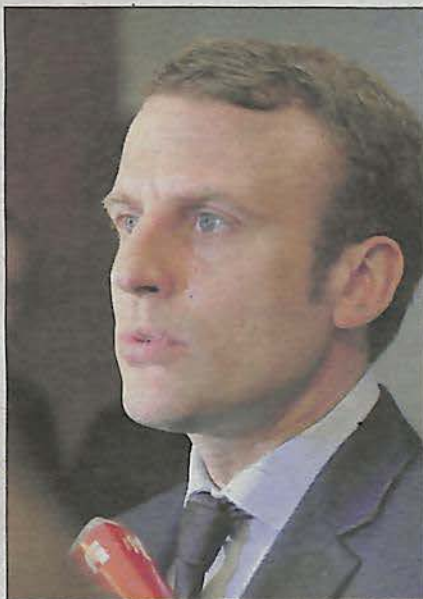
Benoît Hamon, François Fillon et Emmanuel Macron.