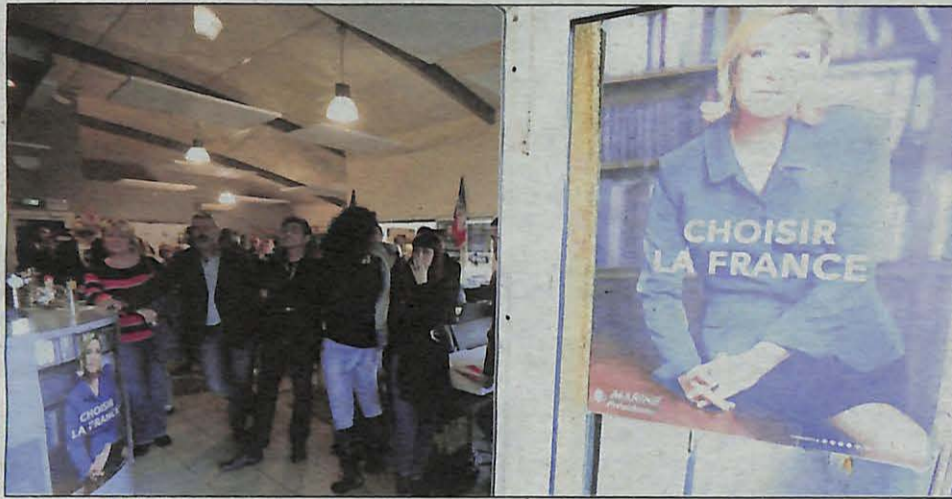
« Ce qui m'arrive du Var, c'est qu'on est large ». Parole de début de soirée, finalement mise à mal. Le FN atteint quand même 49,15 % des voix.