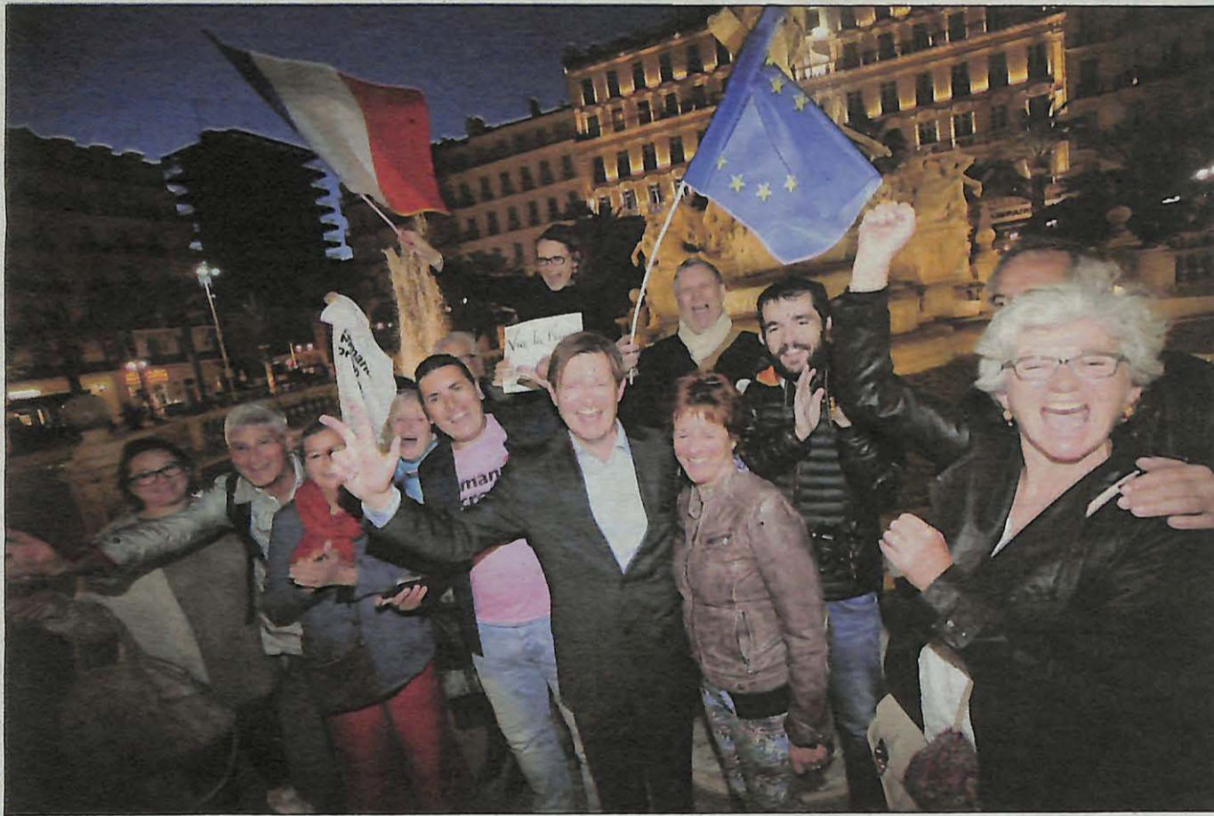
Scènes de la soirée présidentielle, hier, saisies à Toulon, Fréjus, Draguignan et Brignoles.