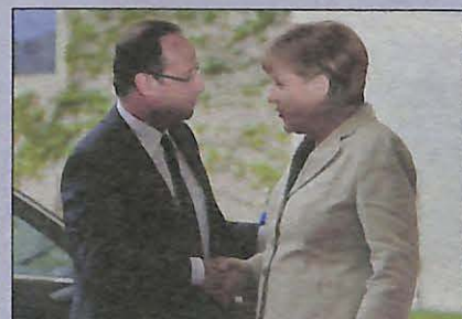
Entre Angela Merkel et François Hollande, les relations avaient été difficiles au début (ci-dessus leur première rencontre après son investiture, le 15 mai 2012).

La dirigeante allemande, qui avait déjà reçu ce centriste europhile à la chancellerie lors de la campagne électorale française, l'avait chaudement félicité dès le soir de sa victoire, le 7 mai. Elle avait par la suite souligné qu'il portait les espoirs de « millions » de Français et d'Européens, et qu'il défendait « l'ouverture sur le monde ». Il est de tradition que le premier déplacement à l'étranger d'un nouveau dirigeant français soit en Allemagne.