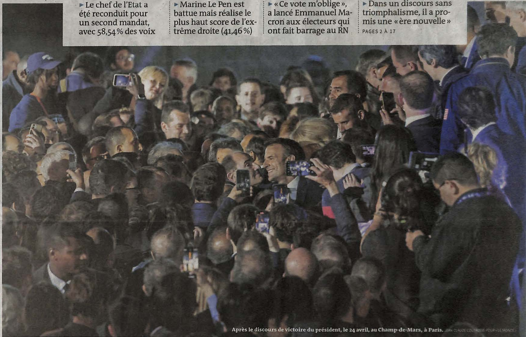
Après le discours de victoire du président, le 24 avril, au Champ-de-Mars, à Paris.