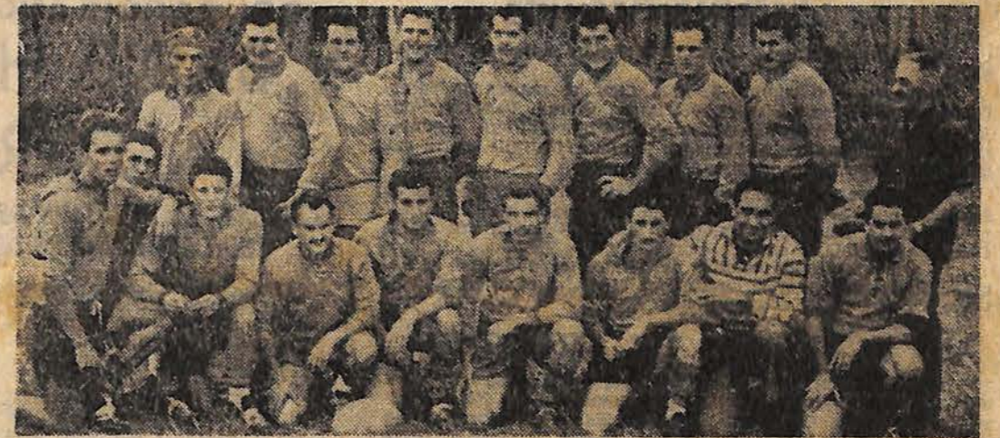
Equipe de l'U.S.S.F.C.M., qui défendra cet après-midi les couleurs seynois, contre le R.C. Nice.