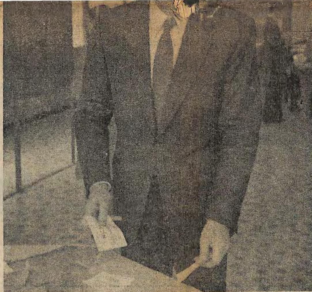
Georges Marchais a accompli, très tôt hier matin, son devoir de citoyen.

En refusant de réaliser l'union de la gauche sur le NON les formations de la gauche non communiste ont empêché de faire de l'échec subi par M. Pompidou une véritable déroute... »