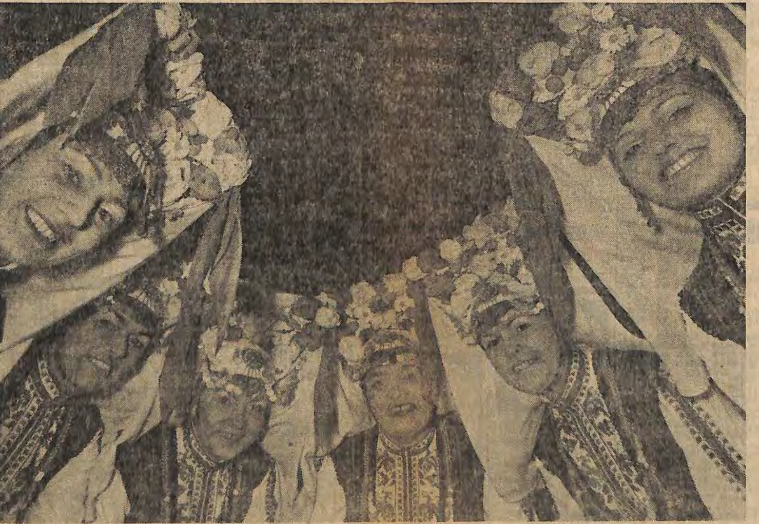
Pour la première fois en France le show bulgare d'Emil Dimitrov est venu pour quinze jours présenter des pantomimes sur des rythmes neufs. Notre photo : Les sœurs Kouchievi durant une répétition.

verrier si les affiches n'étaient pas arrachées des panneaux électoraux.