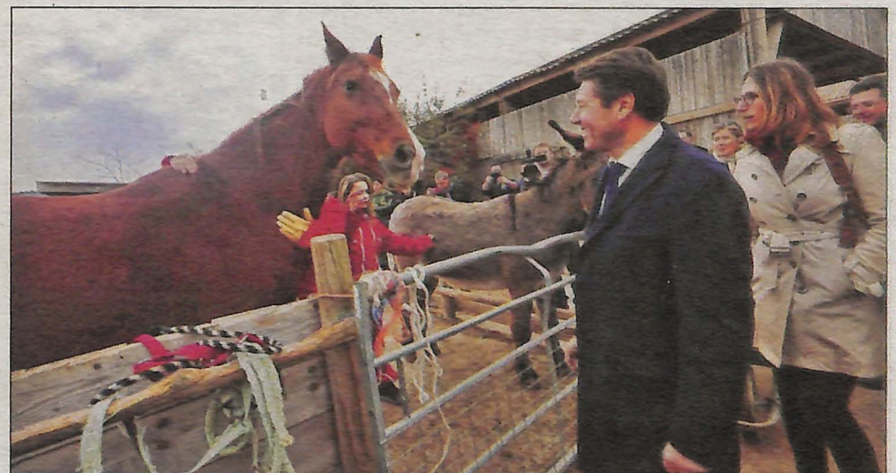
Le lycée « Provence verte » accueille 500 jeunes mais aussi des chevaux !

« L'apprentissage, c'est sans doute la meilleure école de la vie ! » Hier, Christian Estrosi, le candidat LR-UDI aux régionales, a visité, avec sa colistière varoise Maud Fontenoy, le lycée privé « Provence verte » à Saint-Maximin.