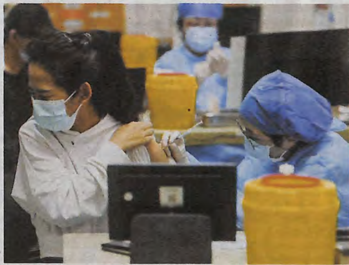
Centre de vaccination d'Hangzhou, dans la province du Zhejiang, le 20 juin.

APRÈS UN DÉBUT de campagne vaccinale poussif, la Chine a su accélérer. A ce jour, plus de 1,12 milliard de doses ont été injectées. Avec 1,4 milliard d'habitants, l'entreprise n'est pas terminée pour autant. Afin de tenir compte de la contagiosité des nouveaux variants et de l'efficacité limitée des vaccins chinois, les objectifs ont été revus à la hausse. « Dans la mesure où nos vaccins ne sont pas protecteurs à 100%, nous devons augmenter la part de la population vaccinée de 66% à 80% au moins, justifie Shao Yiming, épidémiologiste au Centre de contrôle et de prévention des maladies. Cela représente plus de 1 milliard de personnes. » Soit plus de 2 milliards d'injections nécessaires.