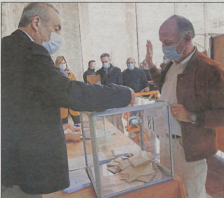
2250 électeurs, répartis en douze bureaux de vote, étaient appelés aux urnes.

2. S'ils ne peuvent voter pour un motif légitime, ils sont remplacés par un autre grand électeur. Si la non-participation au scrutin n'est pas justifiée, l'électeur sénatorial encourt une amende de 100 euros.