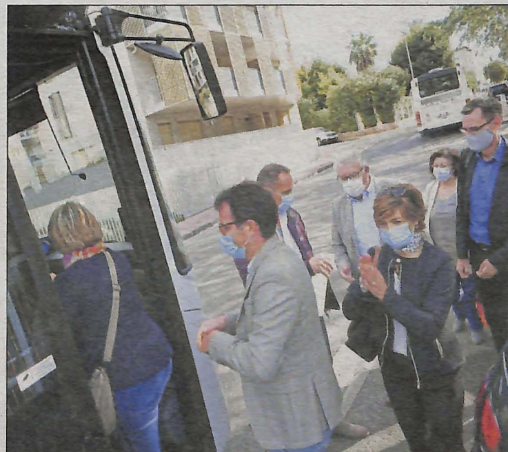
Les grands électeurs de Brignoles sont venus et repartis tous ensemble en bus.