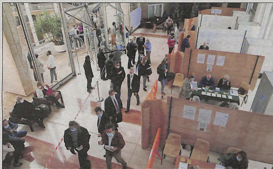
Le bâtiment de la préfecture a permis de mettre en place un circuit pour respecter les gestes barrière.

L'abstention n'est pas de mise pour les grands électeurs (1) qui ont l'obligation d'aller voter (2) . Au nombre de 2 249 dans le Var, ils ont fait la queue, dès l'ouverture du scrutin à 8 h 30 en préfecture de Toulon, pour accomplir leur devoir. Une affluente bien canalisée, de l'arrivée jusqu'à la sortie, par l'organisation, qui a mobilisé une vingtaine de personnels de la préfecture et de prestataires extérieurs pour la sécurité. Un sens de circulation a ainsi été mis en place pour que les électeurs ne se croisent pas. L'architecture du bâtiment préfectoral, qui accueillait cette élection pour la première fois en lieu et place du tribunal judiciaire de Toulon, s'est révélée parfaitement adaptée à l'exercice. Chacun, muni de sa convocation et de son numéro, s'est présenté à l'accueil,