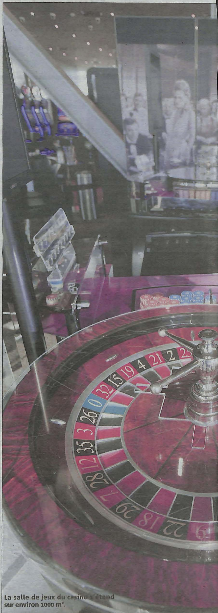
La salle de jeux du casino s'étend sur environ 1000 m 2 .

résidant à moins de 15 km du casino. C'est-à-dire à La Seyne ou dans les communes voisines de Six-Fours, Sanary, Ollioules et Toulon. Nous recevons aussi des clients venant des Bouches-du-Rhône. Ils sont attirés par le côté « package » que nous proposons, avec des produits différents comme la salle de spectacle ».