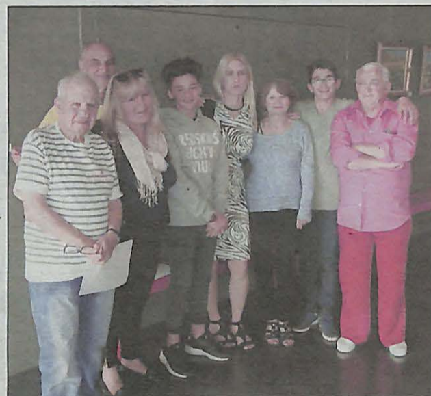
Les premiers élèves ont repris le chemin du théâtre, chez Joa.

1. Téléphone 06.30.36.73.30 ou 04.94.30.55.00. Site: www.theatre-poquelin.com .