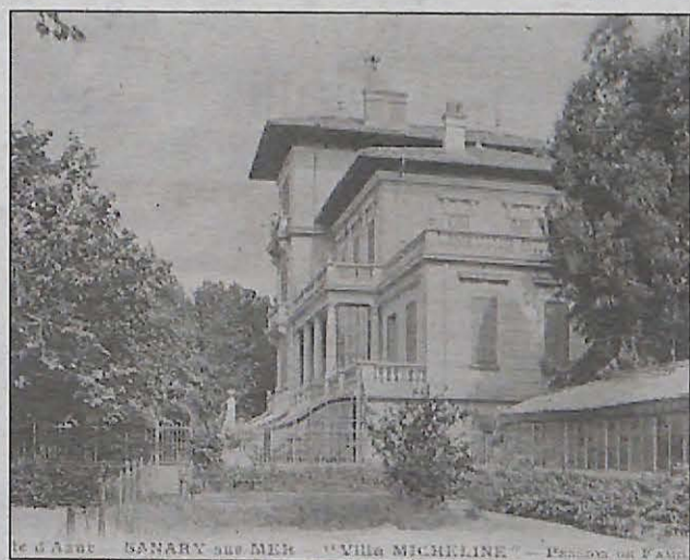
La ville a disposé d'un établissement de jeux de 1936 à 1952 à la Villa Micheline.

2010 (Partouche) ont eu pour effet de sans cesse repousser sa réalisation... jusqu'à l'annonce d'hier. « C'est un cas pratique pour tous les étudiants en droit... » souriait Maître Faure, avocat de