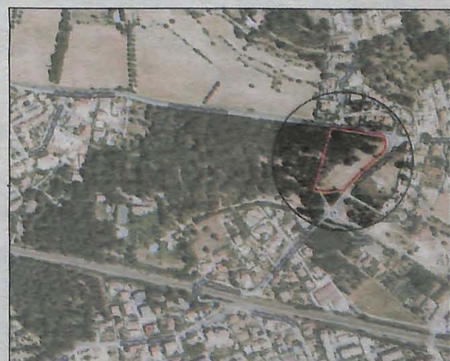
Le casino sera construit sur le terrain de 15 000m 2 situé à l'est du bois du Colombet.

...c'est 11 casinos, dont déjà un dans le Var (Fréjus).