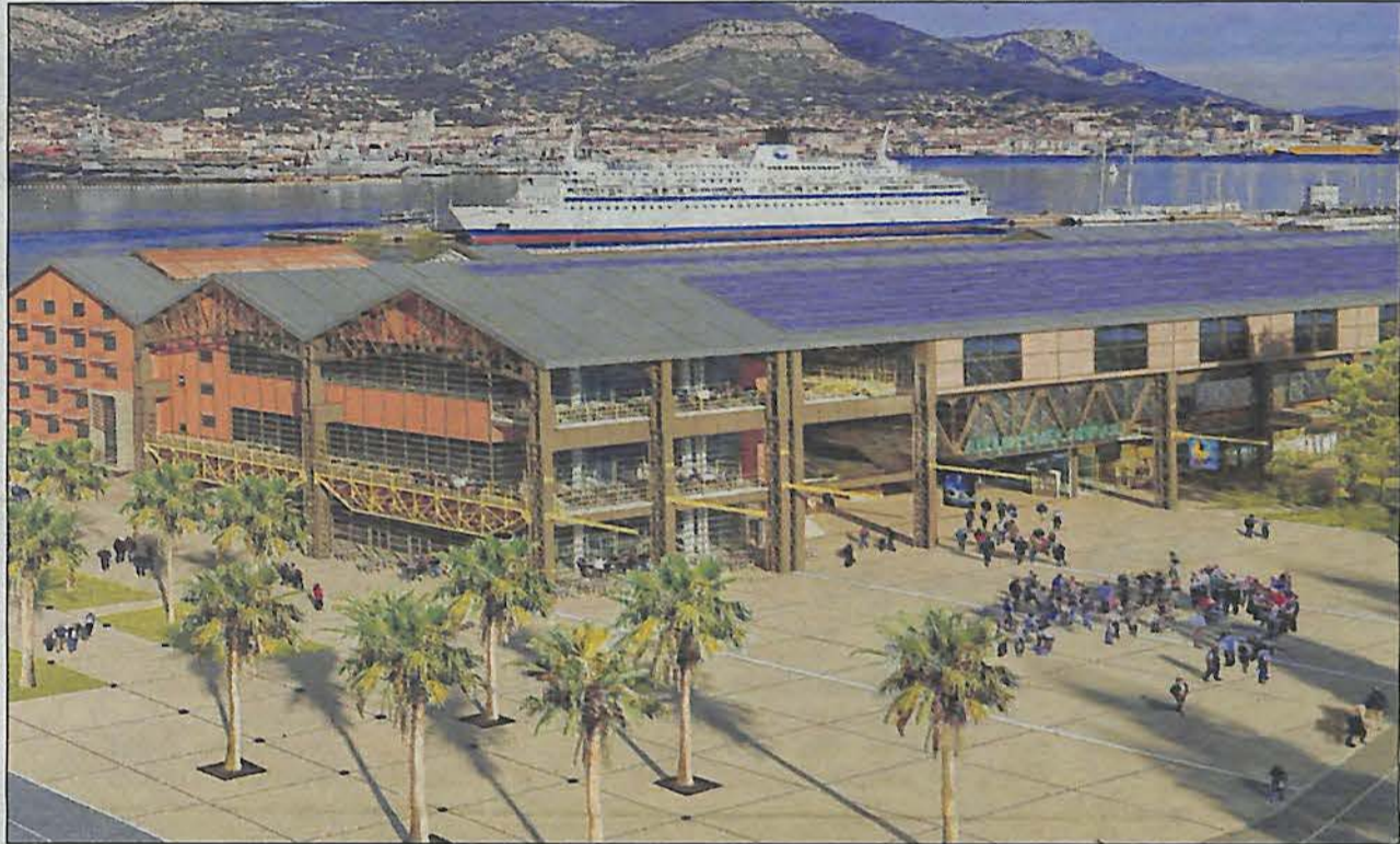
L'ouverture du bâtiment est prévue en septembre 2016. Le projet devrait générer la création de 170 emplois.

Finalement, le projet de reconversion des ateliers mécaniques a été confié au groupement d'entreprises CGR Cinémas/Immo-