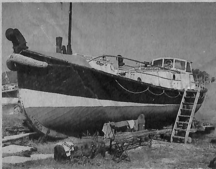
Ceux de L'Herminier héritent de l'historique remorqueur "Le Laborieux", et des conseils éclairés d'un de ses anciens capitaines.