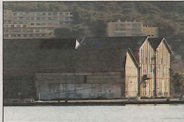
Les domaines de la plaisance et de la culture ont la préférence du maire pour la future activité du hangar CPM.