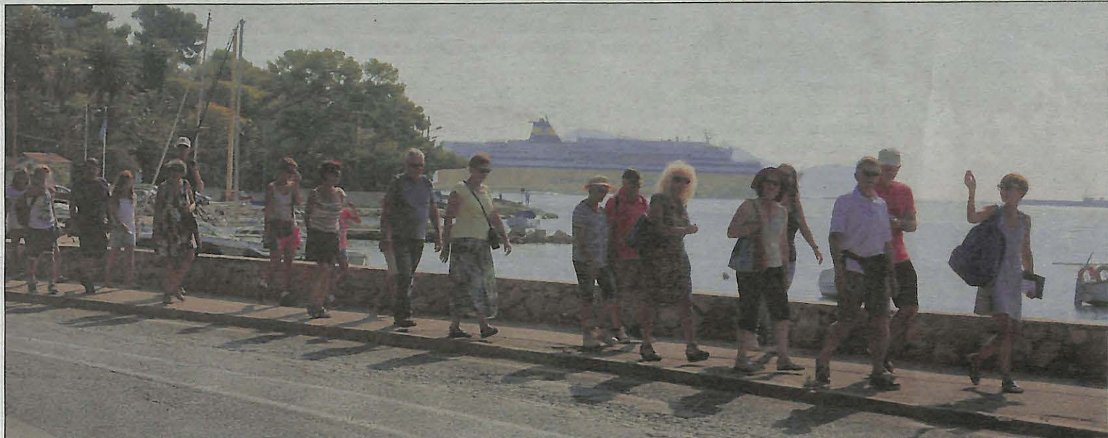
Le long de la corniche Michel Pacha, des dizaines de curiosités à voir... pour qui se lève tôt.