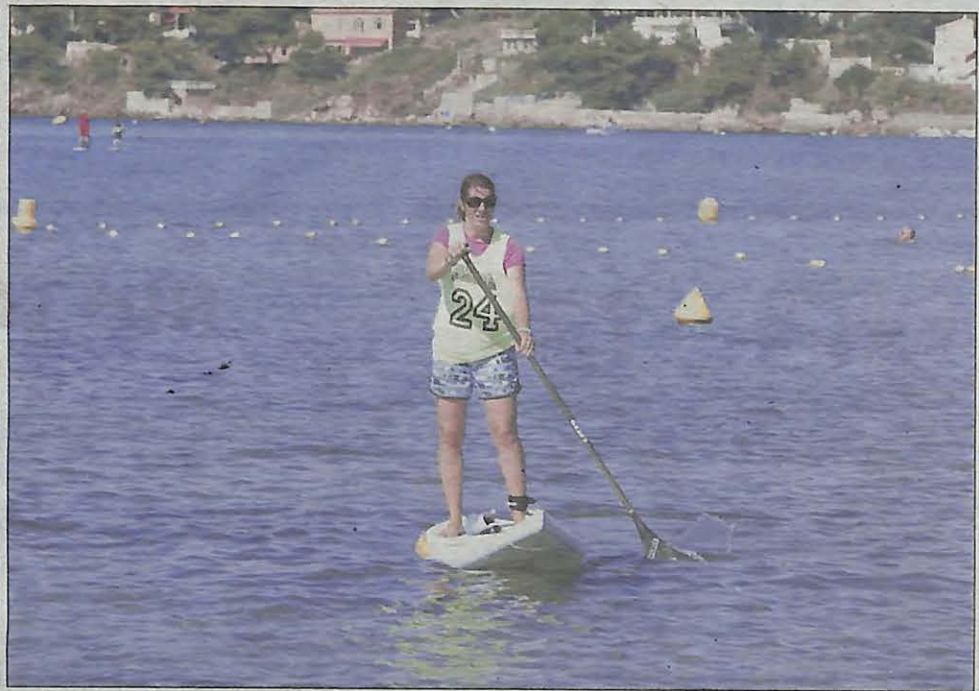
L'épreuve de nage libre s'est disputée sur 300 ou 900 m. Sur paddle, deux parcours étaient proposés : 3 ou 6 milles marins.