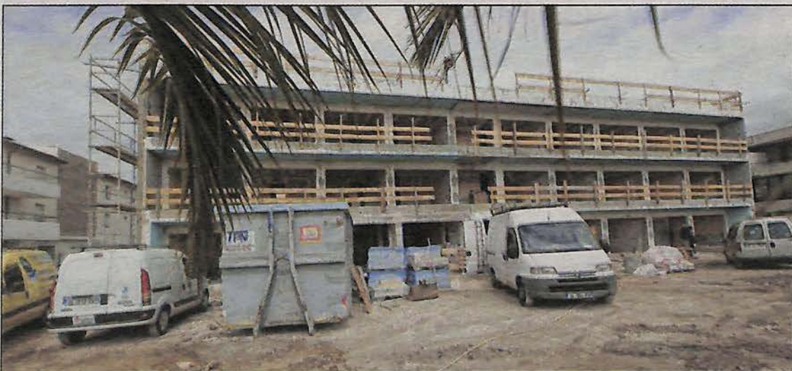
Le chantier a débuté fin janvier. Seule la structure du bâtiment a été conservée.