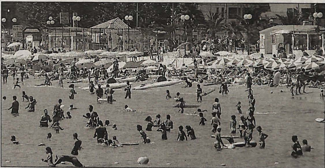
La plage des Sablettes, telle qu'elle ne sera plus l'été prochain.