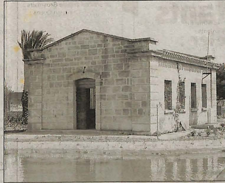
Cette bâtisse signée du célèbre architecte Pouillon va devenir la Maison du parc et abritera différentes animations, notamment à l'attention des scolaires.