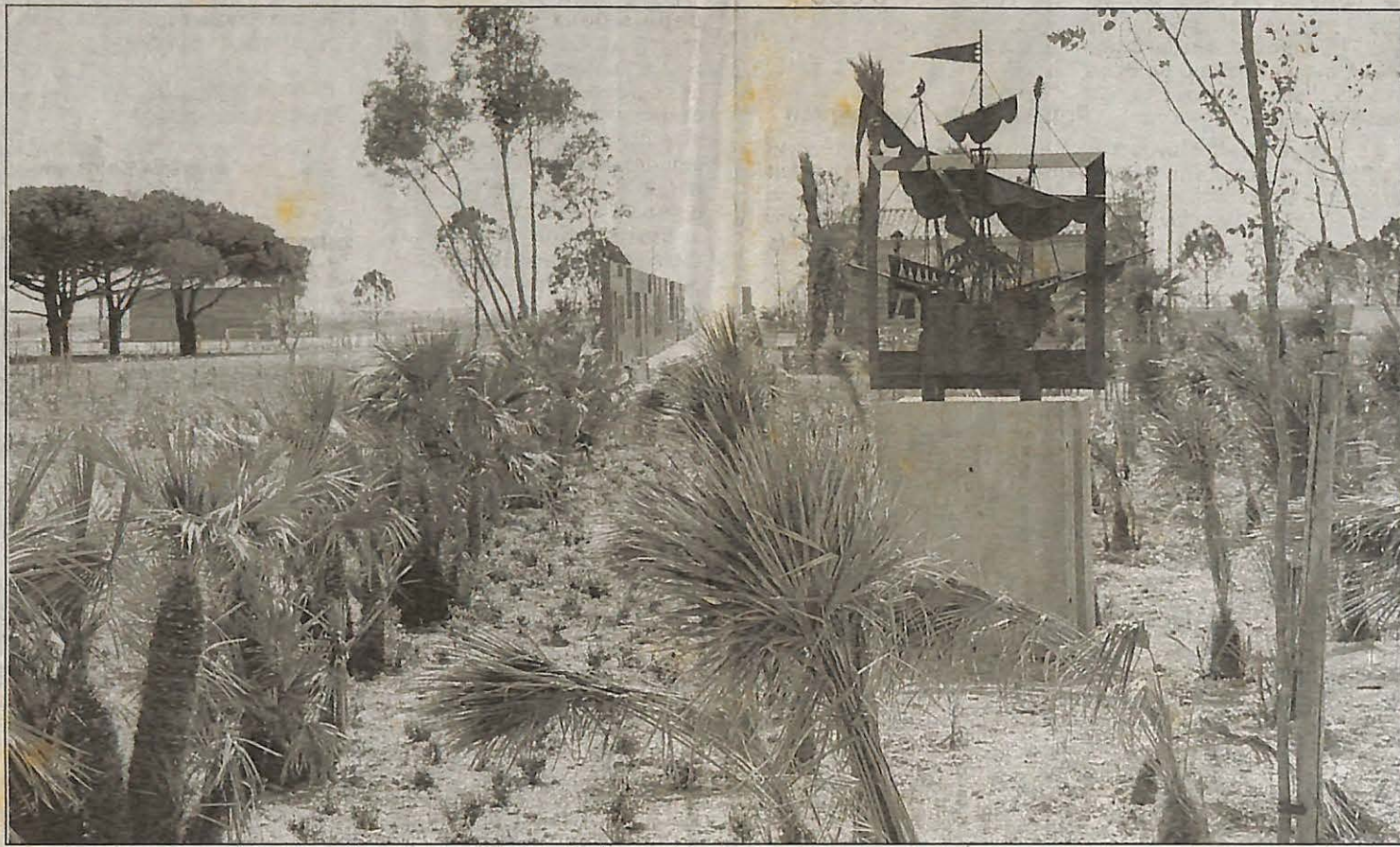
L'isthme dévoilera dès ce week end, ses sculptures, ses aménagements, mais il faudra sans doute attendre encore un peu pour que la végétation rende pleinement ses effets.

Outre la secrétaire d'Etat au tourisme, des milliers de Varois sont attendus ce week-end pour l'inauguration du parc paysager des Sablettes, et après eux des millions de touristes