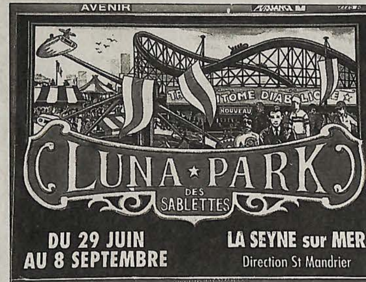
Les affiches sont là pour confirmer la chose.