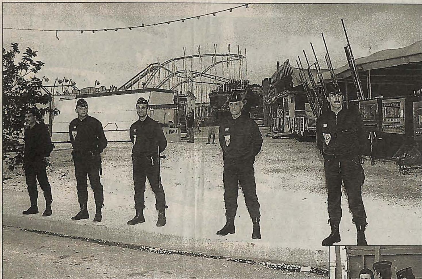
La compagnie de la C.R.S. 59 d'Ollioules a pris position, hier soir, tout autour du Luna-Park afin d'empêcher l'accès au site.