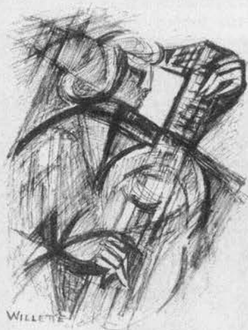
"Le Ménétrier" dessin original de Anne WILLETTE